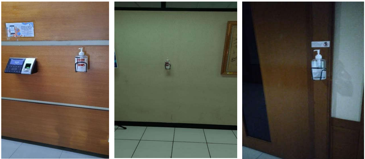
Gambar 5 Pembuatan Hand Sanitizer di Laboratorium ANRI