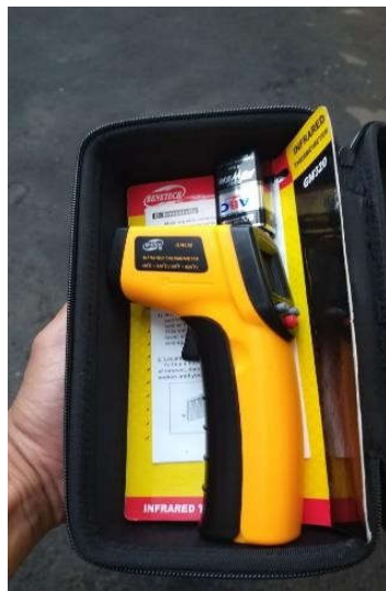
Gambar 3 Peralatan Pencegahan COVID-19

Dalam rangka pencegahan dan penanganan COVID-19, ANRI telah melengkapi sarana prasarana untuk mendukung penanggulangan penyebaran COVID-19 dimaksud, seperti pemasangan hand sanitizer di beberapa titik strategis, pemasangan bilik sterilisasi, pengadaan alat kesehatan (alat pengukur suhu tubuh, perlengkapan klinik, masker, dan lain-lain), dan wastafel portable sebagai tempat pencucian tangan, serta alat peraga physical distancing di lift. Selain itu dalam rangka menjaga persediaan hand sanitizer di ANRI dan program bantuan bagi masyarakat sekitar, maka dilakukan fasilitasi pengadaan bahan baku pembuatan hand sanitizer yang dibuat sendiri oleh ANRI.