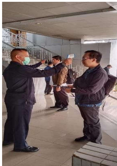
Pengecekan Suhu Tubuh Pegawai dan Tamu