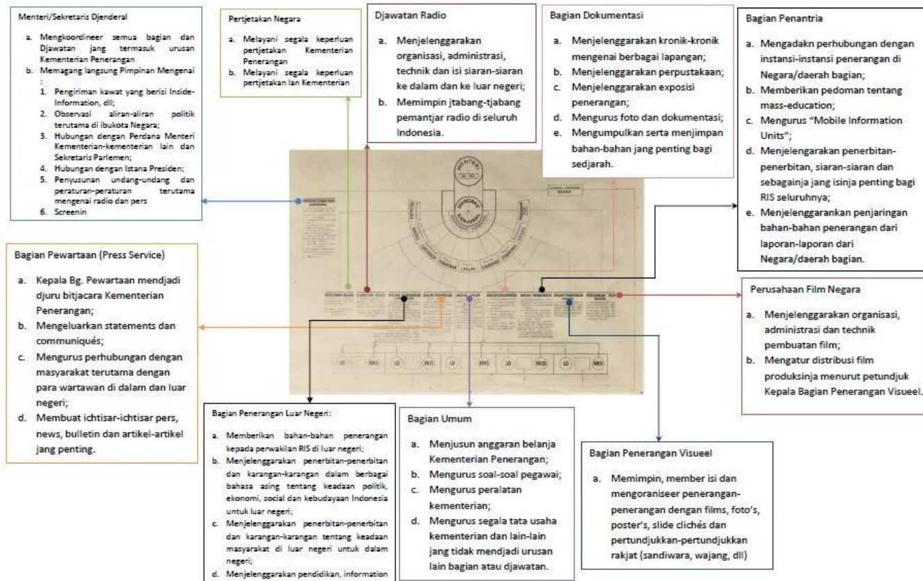
Struktur Departemen Penerangan Pada Periode RIS Tahun 1950

Susunan organisasi Kementerian Penerangan RI selanjutnya mengalami perubahan pada tahun 1959 dengan dikeluarkannya Surat Keputusan Menteri Muda Penerangan RI No. 14/SK/SD/59 tentang Peraturan Susunan Organisasi Kementerian Penerangan Pusat. Dengan adanya perubahan tersebut, maka susunan Kementerian Penerangan Pusat terdiri dari Biro Menteri/Sekretaris Jenderal, Direktorat Tata Usaha, Direktorat Publisiteit dan Penerangan Daerah, Direktorat Perfilman Negara, Jawatan Radio, Biro Hubungan Pers dan Masyarakat, serta Biro Grafika. Pada perkembangan selanjutnya, Kementerian Penerangan berganti nama menjadi Departemen Penerangan, sesuai