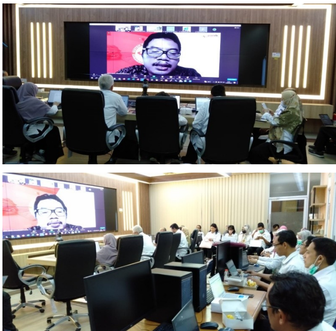
Gambar 3.1 Kegiatan Penilaian Interviui Pemantauan/Evaluasi SPBE ANRI Tahun 2023 oleh Kementerian PAN dan RB

Kegiatan penilaian interviu yang merupakan proses klarifikasi dan validasi Asesor Eksternal terhadap bukti dukung yang disampaikan oleh ANRI sudah dilakukan oleh Kementerian PAN dan RB akan dilaksanakan pada tanggal 11 September 2023 secara online (daring).