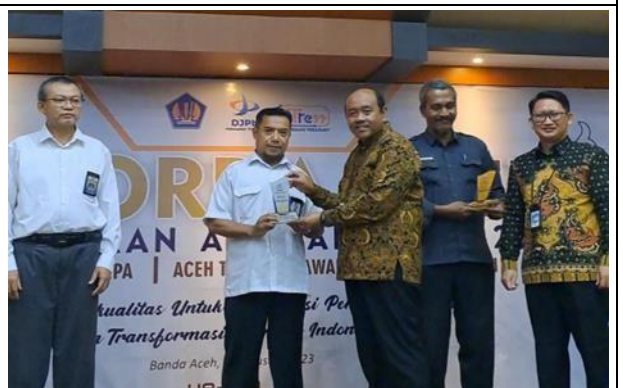
Balai Arsip Tsunami Aceh terima Penghargaan Aceh Treasury Awards Tahun 2023