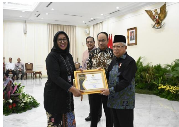
Anugerah KIP 2023, ANRI Kembali Raih Predikat Informatif