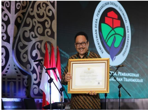
Anugerah Meritkrasi, ANRI Raih Penghargaan Sistem Merit Sangat Baik