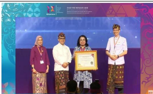
Direktorat SDM Kearsipan dan Sertifikasi ANRI Raih Penghargaan Zona Integritas Tahun 2023