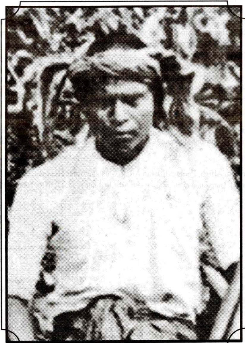
TEUKU UMAR