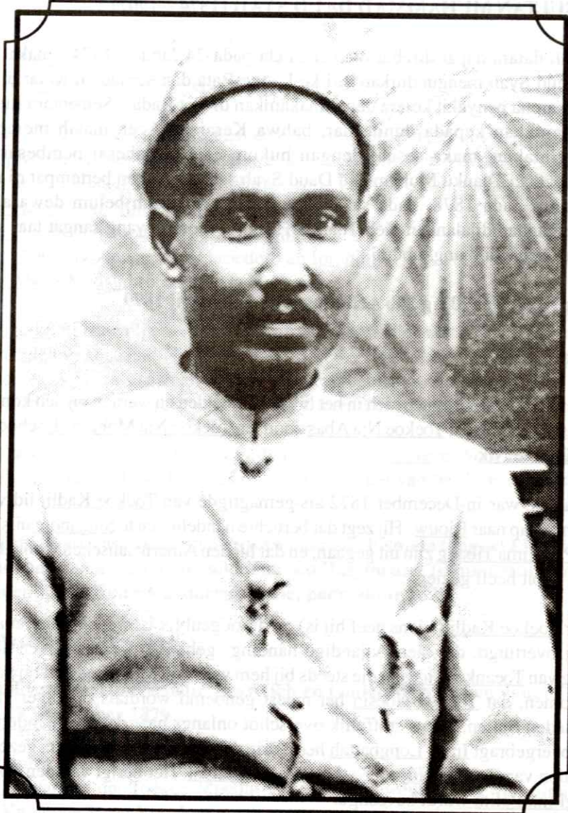
SULTAN MUHAMMAD DAUD SYAH