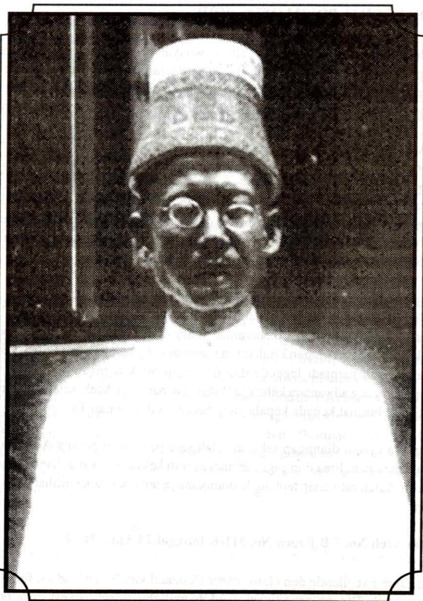
PANGLIMA POLIM